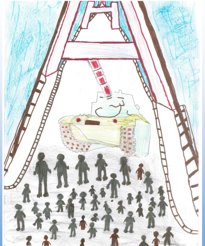
Havin AYDIN 6/E Sınıfı