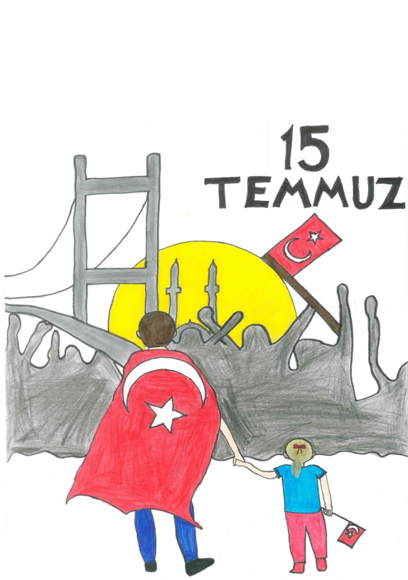
Meryemnur ATEŞ 6/E Sınıfı